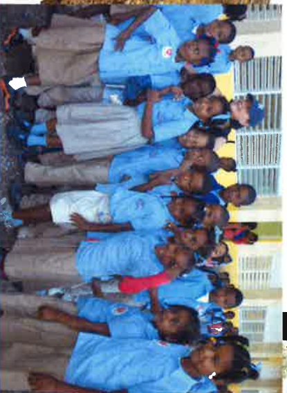
Estudiantes de la escuela Fe y Alegría