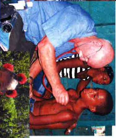
Doctor visitante en la montañosa y remota región de Hondo Valle.