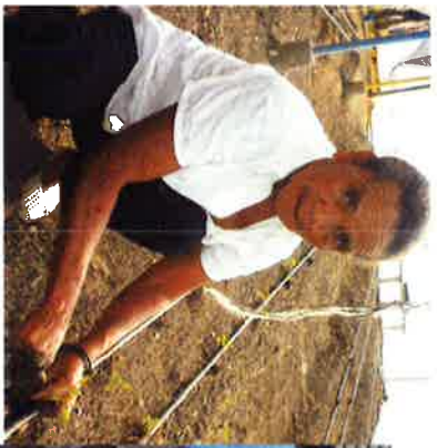
Mujer sembrando en un invernadero de la Federación de Agricultores