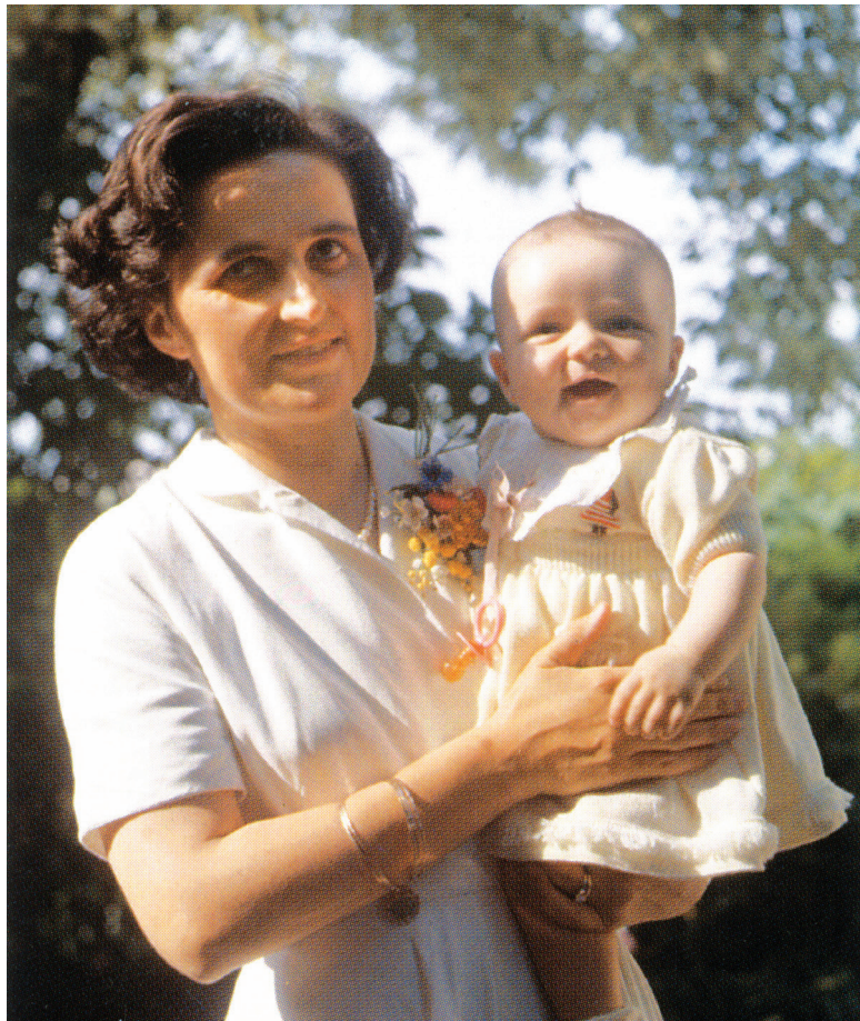
Sta. Gianna Molla