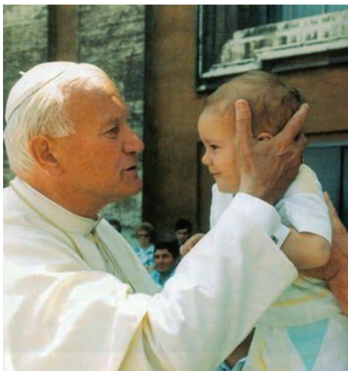
Pope St. John Paul II

One of his greatest contributions to the Church was his presentation of the long-standing truths of Catholic moral theology to the modern world. Between the years 1979 and