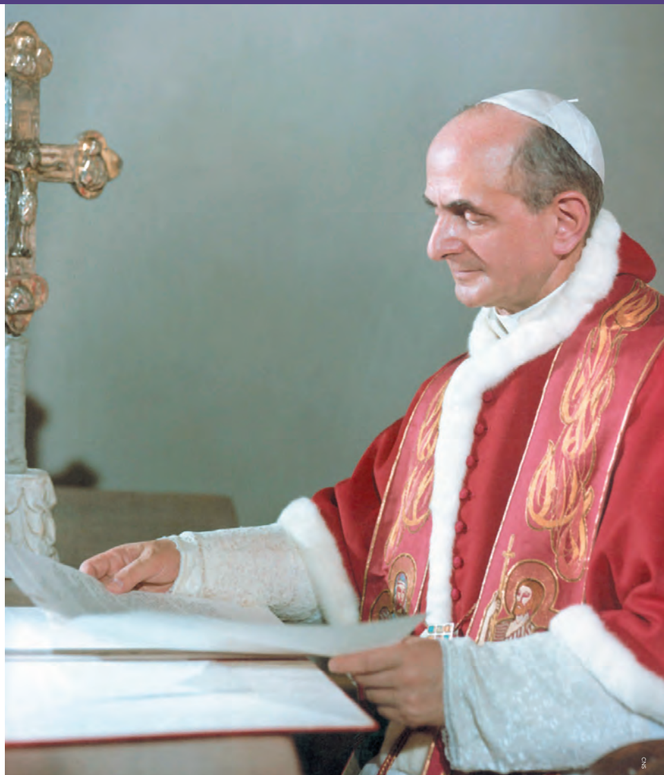
Pope Blessed Paul VI

It is interesting to note that these prophecies were roundly mocked and were considered extreme and even fantastic in the Pope’s day. The promise of contraception was that by removing the possibility of having children if the couple did not want them, men and women would be drawn closer together into more loving relationships. The respect and understanding between the sexes would increase as never before once they were relieved of the “pressure” of having children. Contraception was a private choice to be decided by couples, and would never become a matter of public policy, or coercive action by