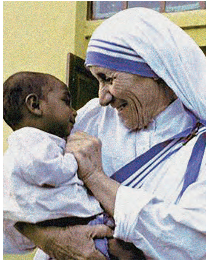
St. Teresa of Calcutta

The Gianna Center can assist couples who wish to conceive in methods that are natural, holistic and healthy for both mother and child, and morally acceptable.