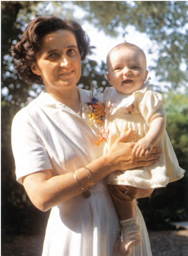
St. Gianna Molla