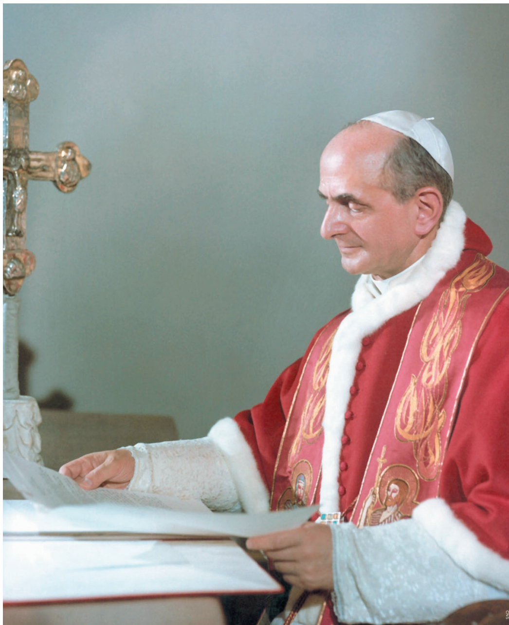
El Papa Beato Pablo VI