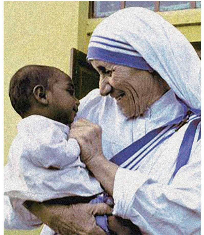
Sta. Teresa de Calcuta

en la planificación familiar natural, y no a sí mismos, como ocurre en la anticoncepción. Una vez que el amor viviente es destruido por la anticoncepción, el aborto sigue muy fácilmente. También sé que hay grandes problemas en el mundo, que muchos cónyuges no se aman lo suficiente como para practicar la planificación familiar natural. No podemos resolver todos los problemas en el mundo, pero nunca nos metamos en el peor problema de todos, y eso es destruir el amor. Y esto es lo que sucede cuando le decimos a la gente que practique la anticoncepción y el aborto. 23