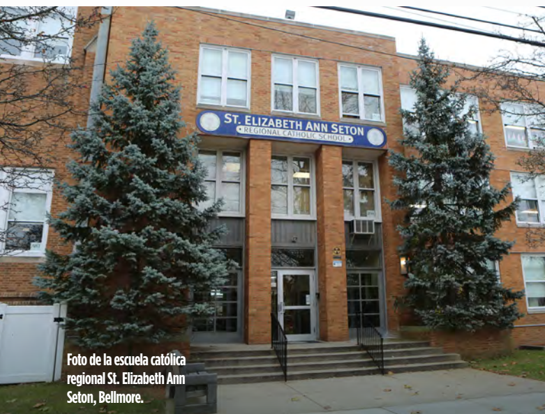
Foto de la escuela católica regional St. Elizabeth Ann Seton, Bellmore.