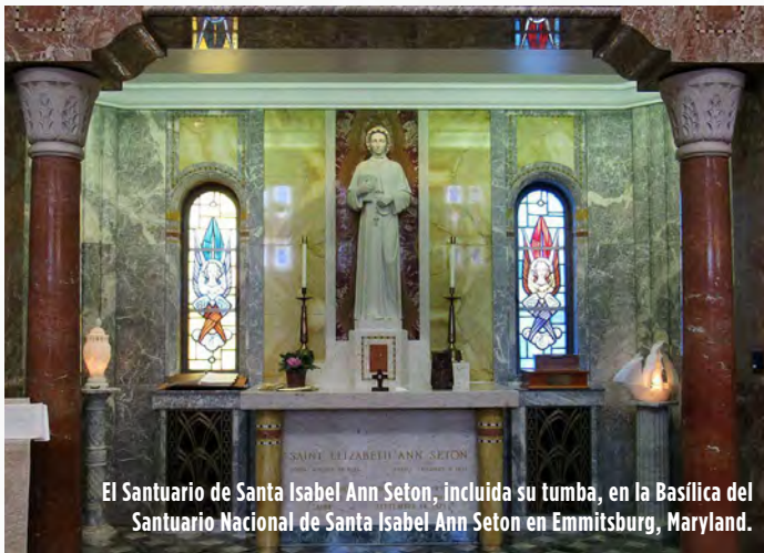
El Santuario de Santa Isabel Ann Seton, incluida su tumba, en la Basílica del Santuario Nacional de Santa Isabel Ann Seton en Emmitsburg, Maryland.

desafíos de nuestra vida. Su camino de fe y el deseo de Dios por encima de todo la llevaron más profundamente a un protestantismo que la dejó insatisfecha. En un viaje a Italia para salvar a su marido, lo perdió. Como joven viuda con tantos que confiaban en ella, Santa Elizabeth fue llamada a abandonar la red de seguridad de su sociedad al ingresar a la fe católica, eligiendo más bien confiar en la providencia de Dios. A pesar de sus constantes dudas, llegó a fundar una orden religiosa y una escuela vibrantes sin haber sido nunca religiosa. Con dudas y temores recurrentes, se encomendó a Dios y dio un salto de fe para seguirlo. Santa Elizabeth estuvo “atenta a la voz de la gracia” a lo largo de su vida y, a cada paso, se encontró bendecida de formas que nunca hubiera imaginado. 5 Más allá de esto, podemos ver cómo en la providencia de Dios esos altibajos fueron una parte esencial de su éxito. Habiendo venido de la sociedad de élite de Nueva York, ella y su esposo estuvieron entre los anfitriones de la gala del 65 aniversario del presidente Washington y eran vecinos de los Hamilton y