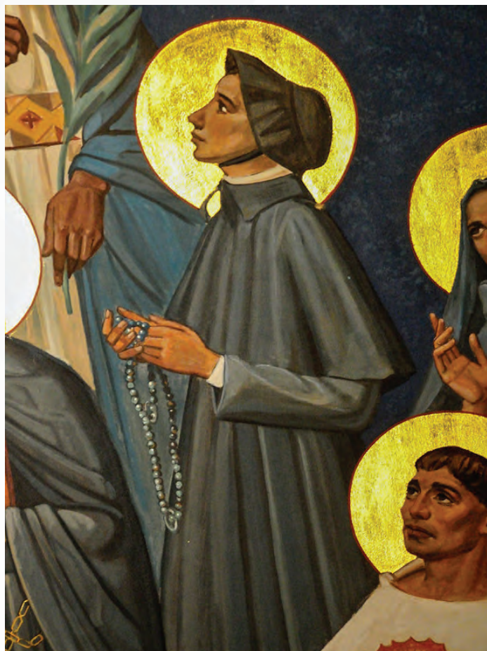
"Saint Elizabeth Ann Seton"

Afortunadamente, la familia italiana con la que se estaba quedando era una familia católica fiel más que dispuesta a apoyar y consolar a Elizabeth en su dolor. Durante los meses que pasó con ellos en Pisa y Florencia, su vida espiritual se transformó una vez más, esta vez por un encuentro con el esplendor de su fe católica en esa tierra extranjera. Ella describe con profunda reverencia sus primeras experiencias