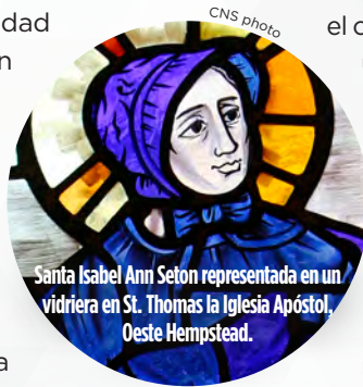
Santa Isabel Ann Seton representada en un vidriera en St. Thomas la Iglesia Apóstol. Oeste Hempstead.

desafíos de nuestra vida. Su camino de fe y el deseo de Dios por encima de todo la llevaron más profundamente a un protestantismo que la dejó insatisfecha. En un viaje a Italia para salvar a su marido, lo perdió. Como joven viuda con tantos que confiaban en ella, Santa Elizabeth fue llamada a abandonar la red de seguridad de su sociedad al ingresar a la fe católica, eligiendo más bien confiar en la providencia de Dios. A pesar de sus constantes dudas, llegó a fundar una orden religiosa y una escuela vibrantes sin haber sido nunca religiosa. Con dudas y temores recurrentes, se encomendó a Dios y dio un salto de fe para seguirlo. Santa Elizabeth estuvo “atenta a la voz de la gracia” a lo largo de su vida y, a cada paso, se encontró bendecida de formas que nunca hubiera imaginado. 5 Más allá de esto, podemos ver cómo en la providencia de Dios esos altibajos fueron una parte esencial de su éxito. Habiendo venido de la sociedad de élite de Nueva York, ella y su esposo estuvieron entre los anfitriones de la gala del 65 aniversario del presidente Washington y eran vecinos de los Hamilton y